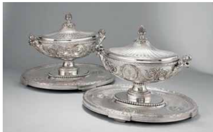
Robert-Joseph Auguste, paire de terrines couvertes, ca 1778-1780, argent ciselé. Collection Musée du Louvre, Paris.