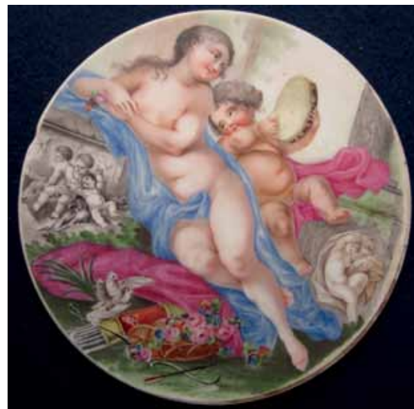
Tondo en porcelaine peinte avec une représentation de Vénus & Cupidon, Paris, XIXe siècle.